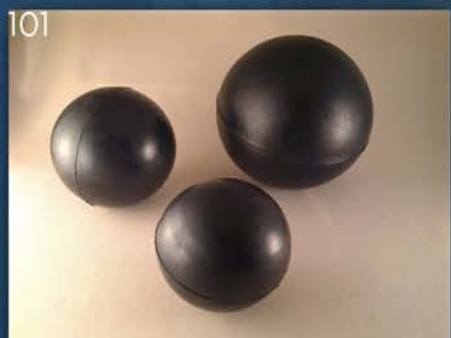
GUMENE KUGLE CISTERNE OSEKE