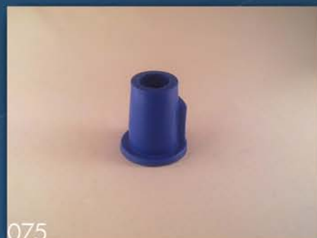
BIKSNA POD KOŠ