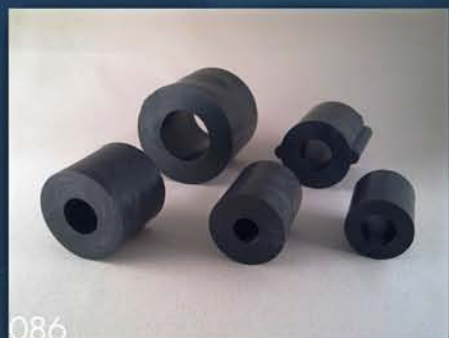
GUMENE ČAURE ZA LADJU KOMBAJNA