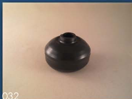
ZAŠTITNA GUMICA RUČICE MENJAČA I REDUKTORA