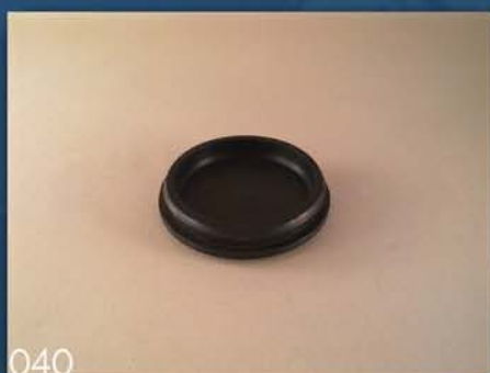
ČEP ZA INSTRUMENT TABLU