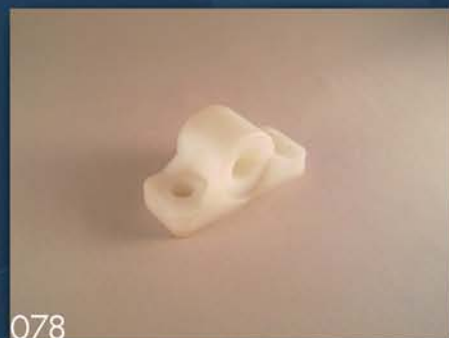
KUĆIŠTE TRAKASTOG SAKUPLJAČA