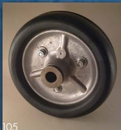
TOČAK REPNOG ŠPARTAČA