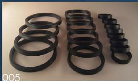
GAR. MANŽETNI ZA KLIPNU PUMPU PRSKALICE