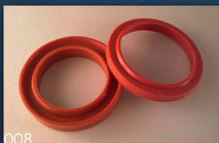
GAR. MANŽETNI ZA PODIZAČ BUNKERA