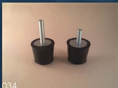
GUMENI DRŽAČ VRATA