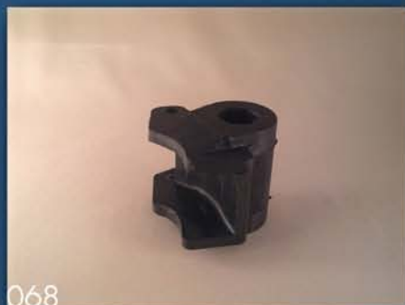
GUMENO KUĆIŠTE SEJALICE