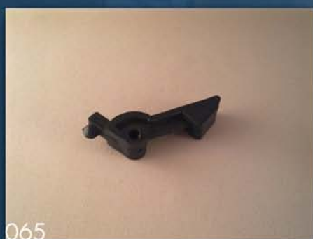
SKIDAČ SEMENA ZA KUKURUZ