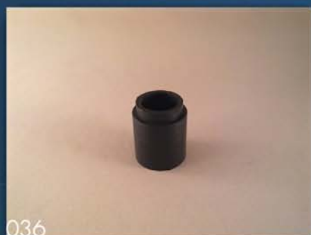
GUMICA VAZDUŠNOG VENTILA