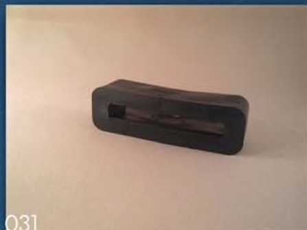
ZAŠTITNA GUMA TOPLINGA (JEZIČAK)