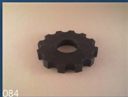
KOMUŠAR BERAČA ZA KUKURUZ