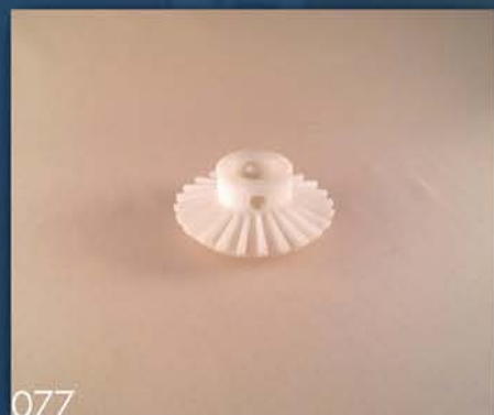
ZUPČANIK P.S.K 113