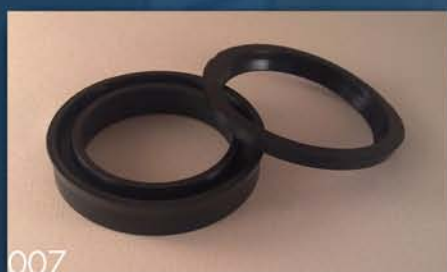
GAR. MANŽETNI ZA PODIZAČ BUNKERA