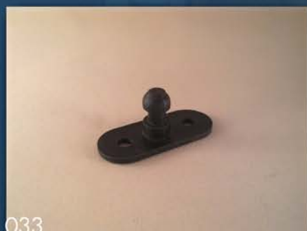
PLASTIČNI DRŽAČ VRATA