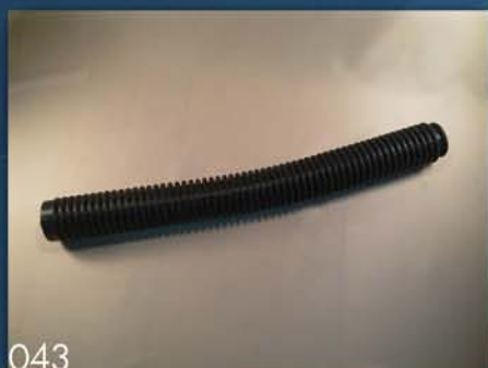
GUMENI UMETAK SEJALICE