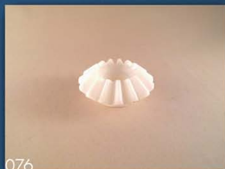
ZUPČANIK P.S.K 112