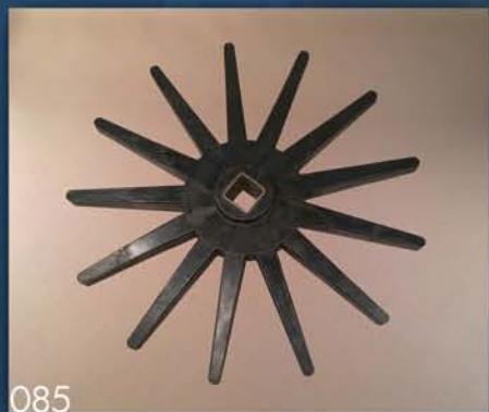
ZVEZDA - BERAČ