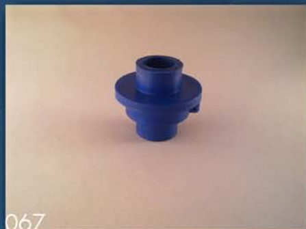
BIKSNA POD SEME