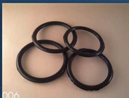
GAR. GUMICA ZA PODIZAČ RUKU