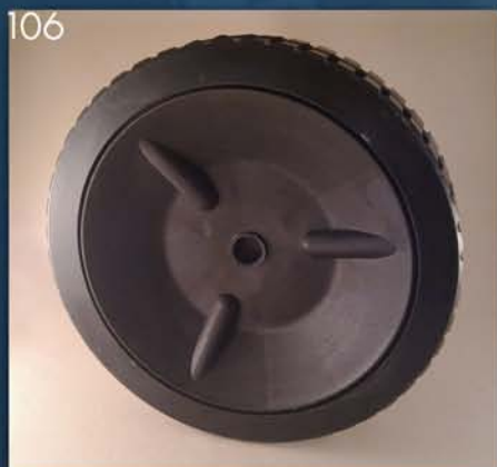
TOČAK KOSAČICE MTD