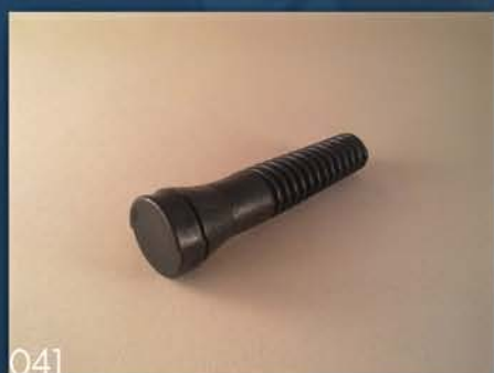
ČERUPAČ ZA PILIĆE