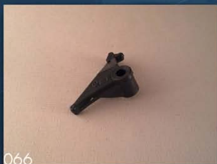
IZBACIVAČ SEMENA ZA KUKURUZ